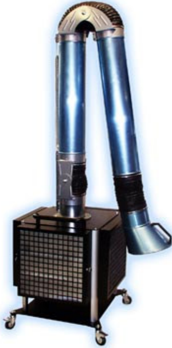
Braccio - Arm BFM 230 (3 mt)